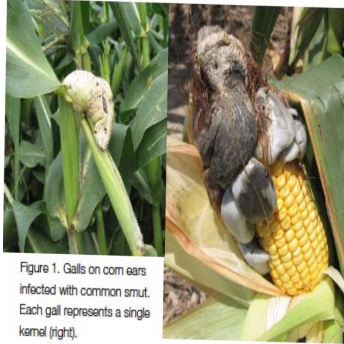
Figure 1. Galls on corn ears infected with common smut. Each gall represents a single kernel (right).