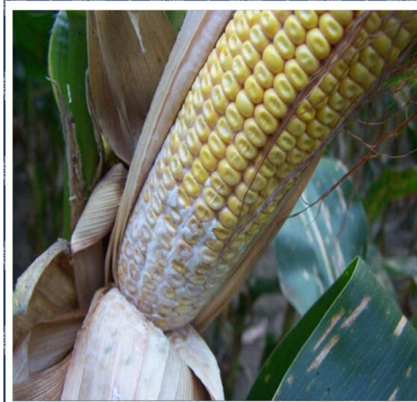
تعفن العرائص الدبلودي