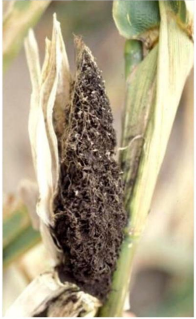
التفحم العادي في الذره الصفراء

• التشتية على هيئة جراثيم تيلية على بقايا التشتية