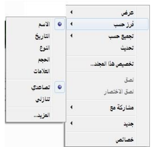
شكل طريقة ترتيب الايقونات