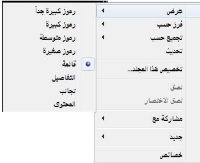
شكل عرض الايقونات