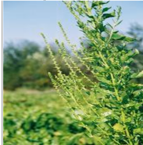
صغيرة خضراء .

مركبة عندما تنتهي النباتات للإزهار فإن الساق تستطيل وتعطي سيقان زهرية تحمل أزهار