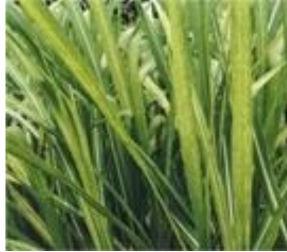
مرض موزائيك قصب السكري