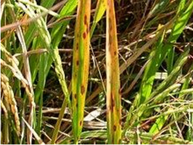
مرض موزائيك الدنان

هذا الدغل شديد المنافسة على نتروجين التربة. وهذا يؤدي الى تركم النتروجين الممتص في انسجة الدنان