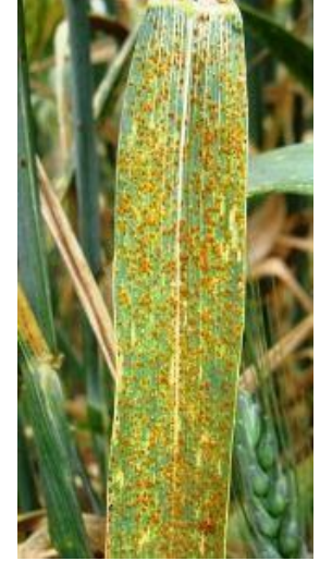
مرض صدا الحنطة